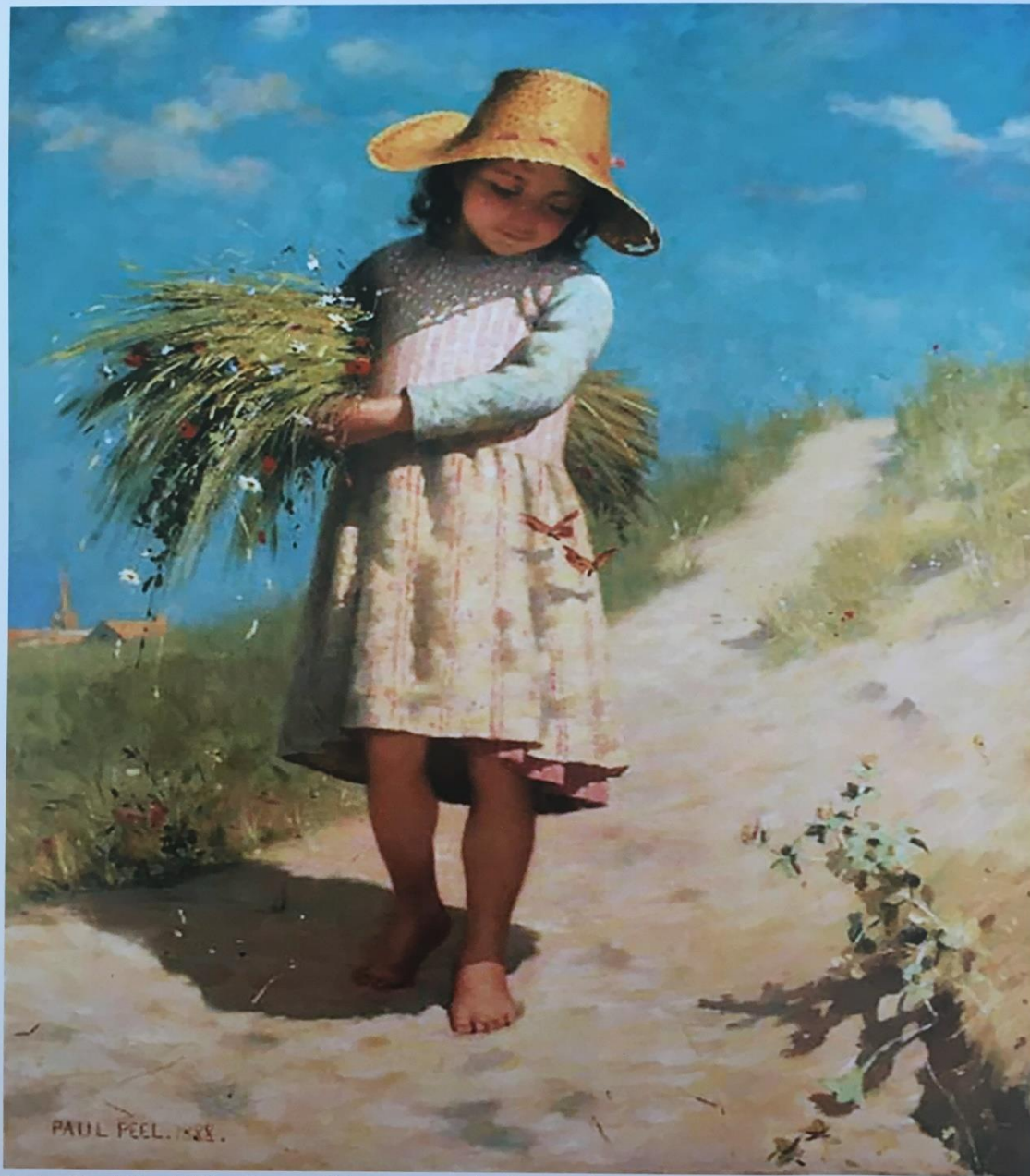
Lato: Paul Peel The Young Gleaner or The Butterflies