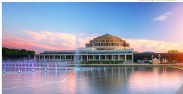
Hala Stulecia / Wrocławskie Centrum Kongresowe