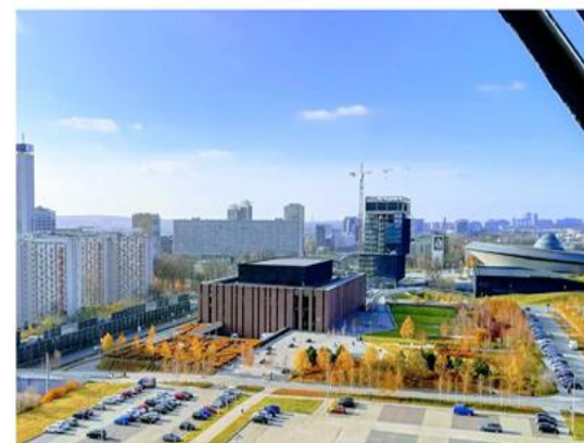
Siedziba Narodowej Orkiestry Symfonicznej Polskiego Radia