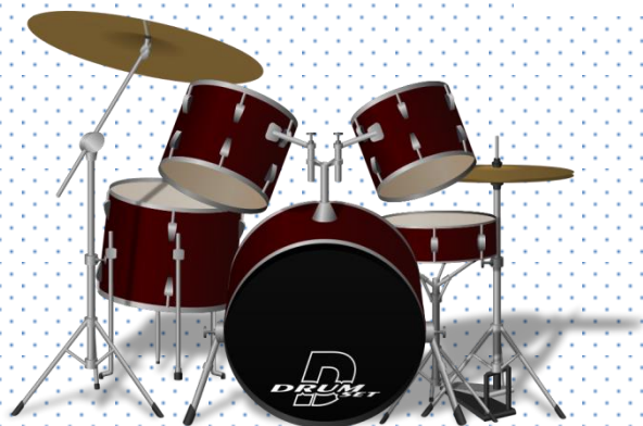
perkusja - perkusista