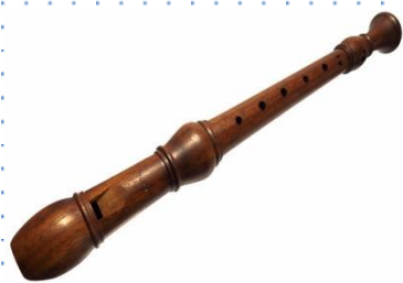
flet – flecista

Kochane dzieci, nazwijcie instrumenty na zdjęciach i spróbujcie nazwać muzyków którzy na nich grają