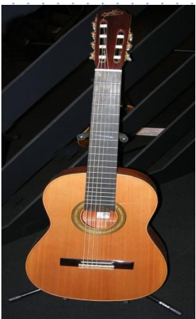
gitara – gitarzysta