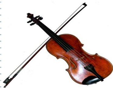
skrzypce - skrzypek