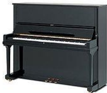
pianino – pianista