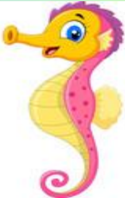
Seahorse (konik morski)