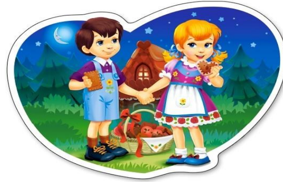
Jaś i Małgosia