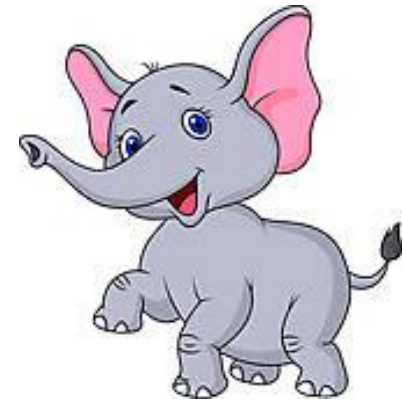
Elephant( czyt. elefant ) - słoń