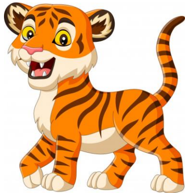
Tiger( czyt. tajger ) - tygrys