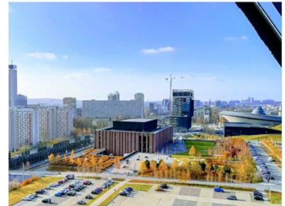
Siedziba Narodowej Orkiestry Symfonicznej Polskiego Radia