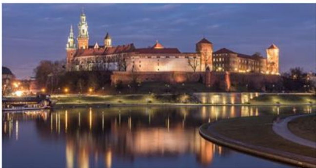
Zamek Królewski na Wawelu