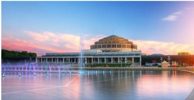
Hala Stulecia / Wrocławskie Centrum Kongresowe