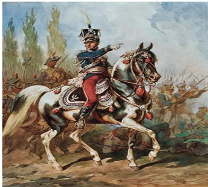
Gen. Jan Henryk Dąbrowski na czele Legionów

Hymnem Rzeczypospolitej Polski jest "Mazurek Dąbrowskiego". W 1797 roku poeta Józef Wybicki napisał "Pieśń Legionów Polskich we Włoszech", którą na cześć generała Dąbrowskiego nazwano "Mazurkiem Dąbrowskiego". Początkowo hymn składał się z 6 zwrotek. 26 lutego 1927 roku Ministerstwo Spraw Wewnętrznych ogłosiło, że jest to hymn Polski.